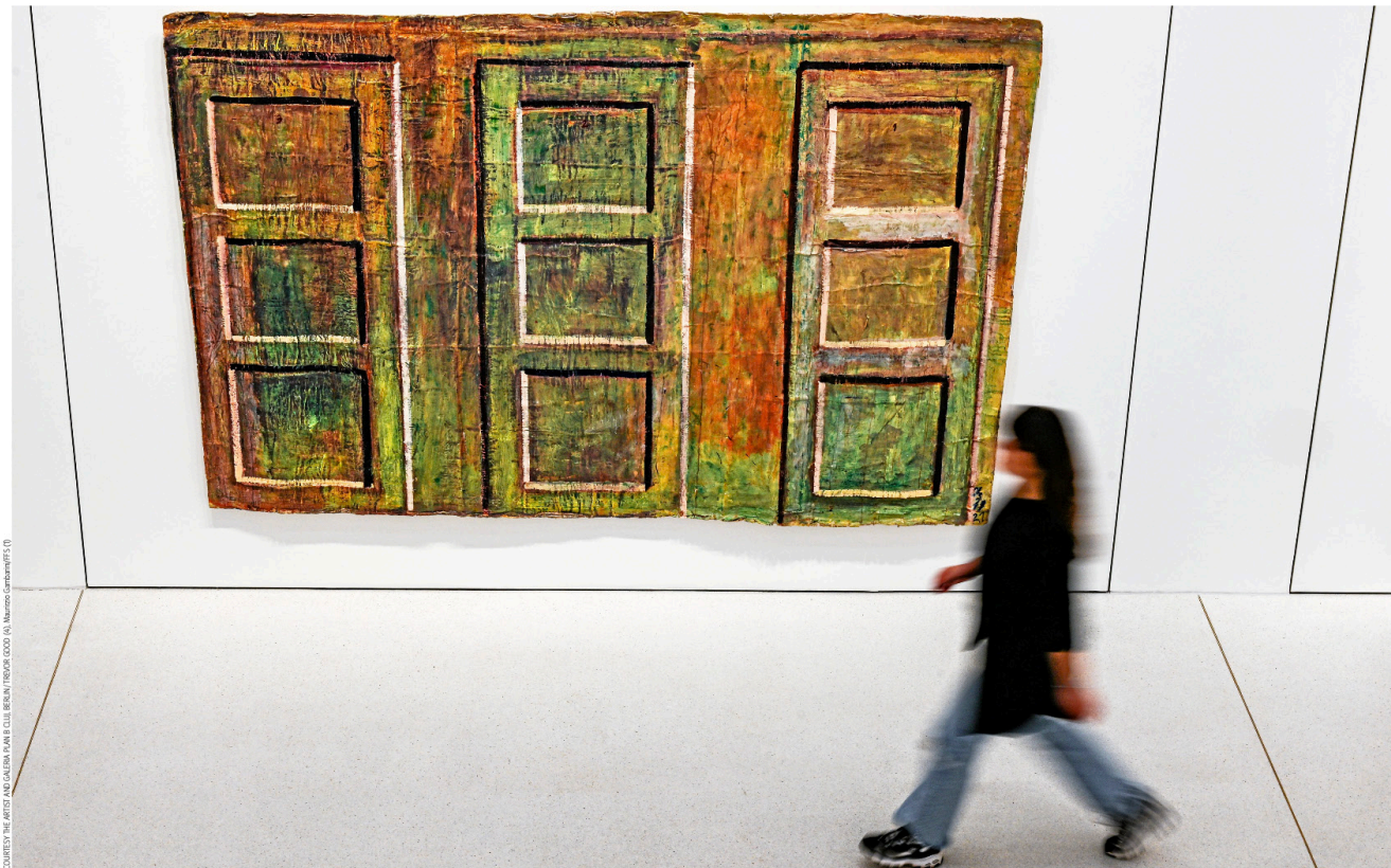
COURTESY THE ARTIST AND GALERIA PLAN B CIUBANU / TROVATI GOOD (A). MARCO GAMBINO/PT5 (D)