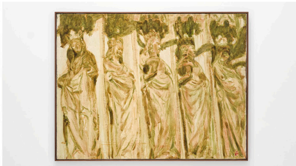
Ioana Batranu, Wise Virgins, 2005.