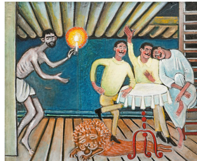
Valentina Rusu Ciobanu: Diogenes or the Lion Tamers, 1968/69.