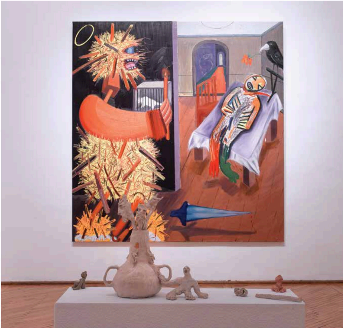
Vedere din expoziție. Exhibition view.